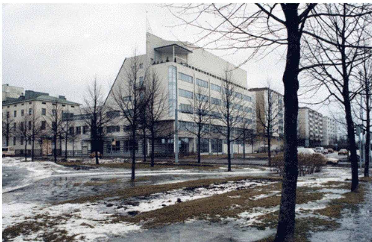
Kuva 33. Wetterhoffin oppilaitokselle vuonna 1993 valmistunut muotoilun koulutusta varten suunniteltu toimitalo.

Opetusministeriö vahvisti Hämeen ammattikorkeakoululle vuonna 1991-92 alkavaa koulutusta varten kahdeksan koulutusohjelmaa, joista yksi oli artonomin tutkintoon johtava käsi- ja taideteollisuuden koulutusohjelma. Kaikkien koulutusohjelmien laajuudeksi vahvistettiin 160 opintoviikkoa. Kesäkuussa 1993 Wetterhoffin oppilaitoksen nimi muuttui Wetterhoffin käsi- ja taideteollisuusoppilaitokseksi. Oppilaitokselle valmistui vuonna 1993 oma uusi muotoilun koulutusta varten suunniteltu toimitalo tuttuun Wetterhoff-kortteliin. Rakennuksen oli suunnitellut arkkitehti Petri Viita.