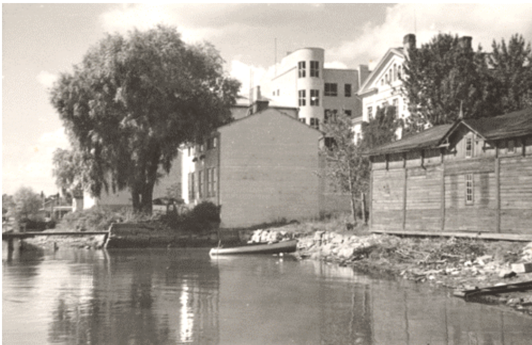
Kuva 13. Wetterhoffin rakennukset 1930-luvun lopulla, jolloin Vanajavesi vielä ulottui aivan Arjanlinnan ja värjäämön viereen.

Opettajakokelaiden harjoitustunnit lisääntyivät neljästä kuuteen vuonna 1939. Näytetunteja oli edelleen kaksi. Harjoitustunneista kaksi oli ompelussa ja kaksi sidosopissa, yksi jommassakummassa ja yksi oli ns. havaintotunti kudonnan alalta. Kolmannen luokan keväällä kokelaat antoivat kaksi näytetuntia, joiden aiheet olivat kudonnan ja ompelun teorian alueelta. Opetus- ja harjoitusohjelmien laadinta alkoi vakiintua kasvatusopin tunneilla 1930-luvulla. Käytännön työnohjaus kudonnan ja ompelun tunneilla aloitettiin 1930-luvun loppupuolella. Tämä tapahtui parin viikon pituisina vuoroina niin, että kokelas ohjasi oppilaita luokan opettajan opastamana.