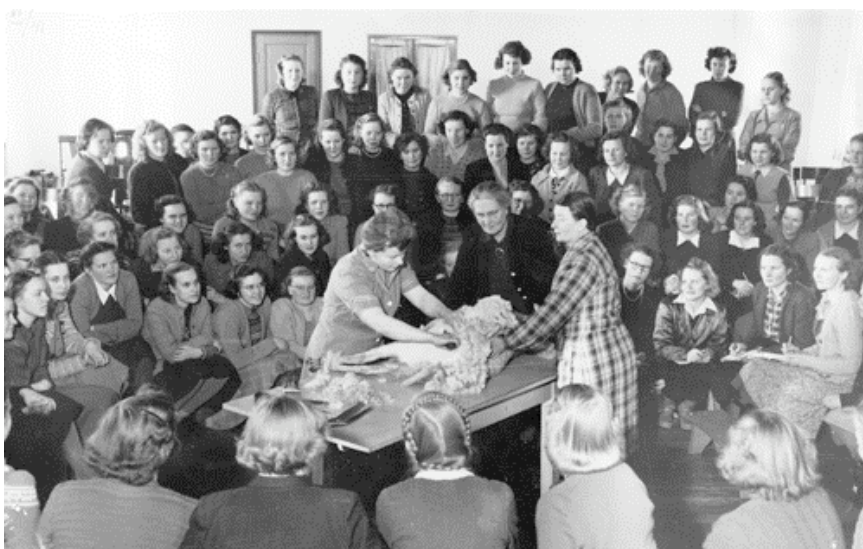
Kuva 18. Havainnollista opetusta Wetterhoffilla vuonna 1951: esitys lampaan keritsemisestä.

Wetterhoffin koulun nimi vaihtui taas, mutta vain lyhyeksi aikaa. Vuosina 1949-51 oppilaitoksen nimenä oli Fredrika Wetterhoffin Naiskotiteollisuuskoulu.