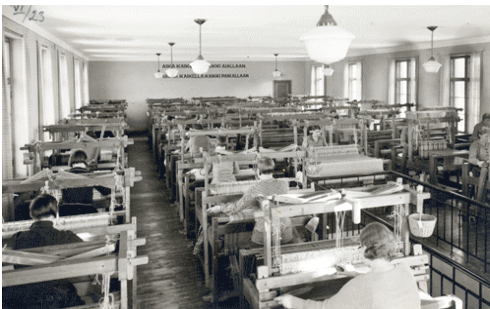
Kuva 14. Wetterhoffin Kotiteollisuusopiston kutomo vuonna 1935. Takaseinällä on tunnuslause "Aika kaikelle, kaikki ajallaan – paikka kaikelle, kaikki paikallaan".

Opettajakokelaiden harjoitustunnit lisääntyivät neljästä kuuteen vuonna 1939. Näytetunteja oli edelleen kaksi. Harjoitustunneista kaksi oli ompelussa ja kaksi sidosopissa, yksi jommassakummassa ja yksi oli ns. havaintotunti kudonnan alalta. Kolmannen luokan keväällä kokelaat antoivat kaksi näytetuntia, joiden aiheet olivat kudonnan ja ompelun teorian alueelta. Opetus- ja harjoitusohjelmien laadinta alkoi vakiintua kasvatusopin tunneilla 1930-luvulla. Käytännön työnohjaus kudonnan ja ompelun tunneilla aloitettiin 1930-luvun loppupuolella. Tämä tapahtui parin viikon pituisina vuoroina niin, että kokelas ohjasi oppilaita luokan opettajan opastamana.