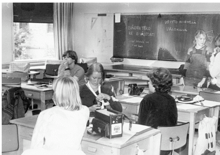
Kuva 28. Kenttätutkimusta tekemään lähtevät oppilaat saamassa opetusta valokuvauskameran käytöstä vuonna 1980.

Fredrika Wetterhoffin Kotiteollisuusopettajaopistossa alkoi ensimmäistä kertaa uusimuotoinen opistokoulutus vuonna 1979, jolloin opistoasteen ammatillinen koulutus ja opettajakoulutus eriytettiin toisistaan. Lukuvuonna 1979-80 lisättiin kolmannella luokalla oppimateriaalin laadintaan, tutkielman tekoon ja seminaareihin tunteja niin, että samalla opetusharjoitustunnit sekä kokeilu- ja laboratoriotunnit vähenivät. Ulkopuolisten luennoitsijoiden määrä lisääntyi oppilaitoksessa 1970-luvun lopulla.