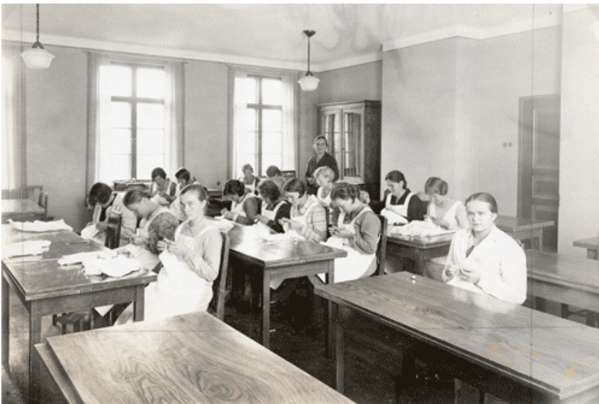
Kuva 10. Ompelutunti Työkoulussa vuonna 1929.