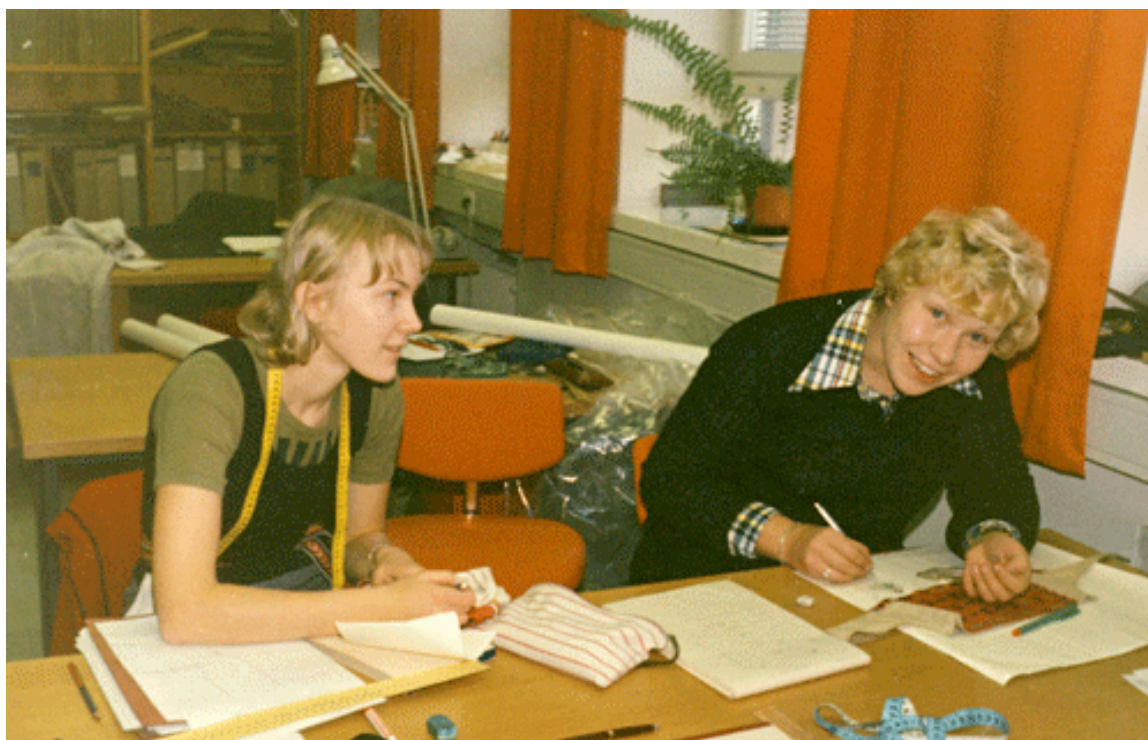
Kuva 32. Opiskelijoita suunnittelutehtävän parissa 1988-89.

Elsa Silpala ja Tuula Heinänen totesivat ”Wetterhoff 100 vuotta” -kirjassaan vuonna 1985, että ”sekä koulu- että opistoasteella teoria-aineiden ja yleissivistävien aineiden osuus opetuksessa on kasvanut. Entuudestaan tuttujen äidinkielen ja vieraiden kielten, matematiikan ja yhteiskunnallisten aineiden lisäksi saavat tulevat käsityöalan ammattilaiset oppia tärkeää tuotesuunnittelua, yritystietoaineita, tietojenkäsittelyä ja markkinointia. Myös työpolitiikka ja taloussuunnittelu antavat opistotasolta valmistuville työelämässä tarpeellisia tietoja.”