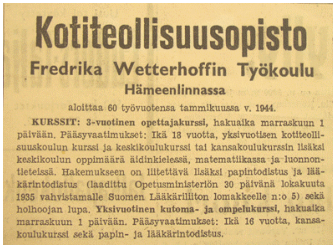
Kuva 15. Kotiteollisuusopisto Fredrika Wetterhoffin Työkoulun ilmoitus Helsingin Sanomissa ja Uudessa Suomessa 4.9.1943

valmisti sukkaa ja lapasia rajantakaisen Karjalan lapsille, kunnes lankavarasto loppui ja kerho lakkautettiin.