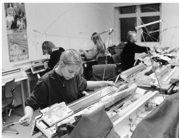
Kuva 30-31: Uusia opintomahdollisuuksia Wetterhoffilla 1985 – savenvalanta ja neuletyö.

Käsi- ja taideteollisuusalan keskiasteen koulunuudistuksen mukaisesti uusiin opetusohjelmiin Wetterhoffilla siirryttiin syksyllä 1985 – heti koulun 100-vuotisjuhlien jälkeen. Keskiasteen koulunuudistuksen myötä tehtiin selvä ero ylioppilaiden ja ei-ylioppilaiden välillä oppilaitokseen haettaessa. Tämä merkitsi koulupohjaisen peruslinjan yleisjakson ja ylioppilaspuoleisten erillisten opintolinjojen muodostamista. Oppilaiden valinta alettiin tehdä yhteisvalinnan kautta. Kouluun tuli vuoden mittainen yleisjakso, johon tultiin peruskoulusta. Sen jälkeen voi jatkaa kouluasteen 2-vuotisella erikoistumisjaksolla joko kudonta-, ompelu-, turkisompelu- tai savenvalajan linjalla. Toinen mahdollisuus oli hakea 4-vuotisen opistoasteen erikoistumislinjoille, joita oli ompelua, neuletta ja kudontaa varten. Ylioppilaat