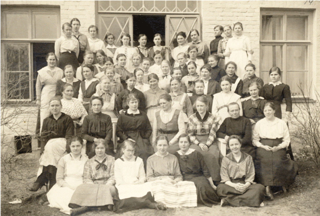
Kuva 5. Fredrika Wetterhoffin Työkoulun opettajat ja oppilaat vuonna 1917.

Opetusharjoittelussa harjoitus- ja näytetuntien pito alkoi vakiintua vuonna 1913 sekä käytännön että tietopuolisen opetuksen tunneilla. Kevätlukukauden aikana 2. luokan oppilaat antoivat jokainen 4 harjoitustuntia opettajataidoissa ja lukukauden lopussa antoivat opettajakokelaat vielä 2 näytetuntia opettajataidoissa.