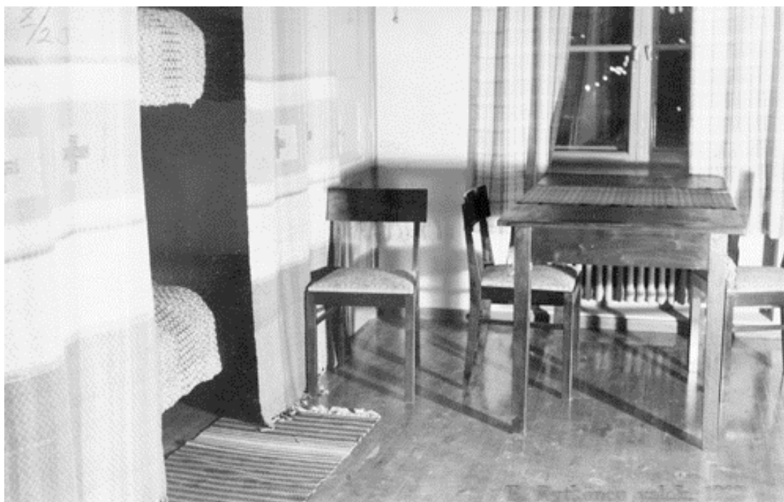
Kuva 12. Opiskelijoiden asuinhuone Arjanlinna-rakennuksessa 1930-luvulla.

Wetterhoffilta vuonna 1934 kotiteollisuusopettajaksi valmistunut nimimerkki "Eeva" muisteli koulun 100-vuotisjuhlan yhteydessä vuonna 1985 julkaistussa sanomalehtipakinassaan opiskeluaikaansa mm. seuraavasti: "Opetus oli täysin koulumaista, teoriaa ja käytäntöä. – Kaikessa johdateltiin oppilaita luovaan työhön. – Kaikki teoriaopetus, vaikka olikin tärkeätä, ei aina ollut mieleen. Pakko oli kuitenkin piirrellä millimetripaperille kankaan sidoksien merkkejä illat pitkät. – Ei ollut tyttöillä vapaa-ajan ongelmia. Nuoria oltiin ja vaikka ulko-ovi suljettiin illalla kello 20.00 oli meillä omat konstimme ulos lähdettyämme päästä myöhäänkin sisään. – Arjanlinnassa meillä oli joka kerroksessa itse valitsemamme 'päivystäjä' ja sovitut merkit, jotka nähtyään hän kipitti avaamaan oven. – Koulu oli tiukka. Kolmisenkymmentä aloitti, mutta matkan varrella karsiutui, niin että meitä samanaikaisesti valmistui vain kaksitoista."