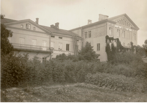
Kuva 7. Työkoulun rakennukset pihalta päin.