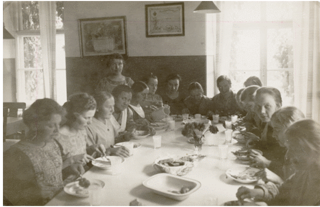
Kuva 8. Näkymä koulun ruokasalista vuonna 1926.