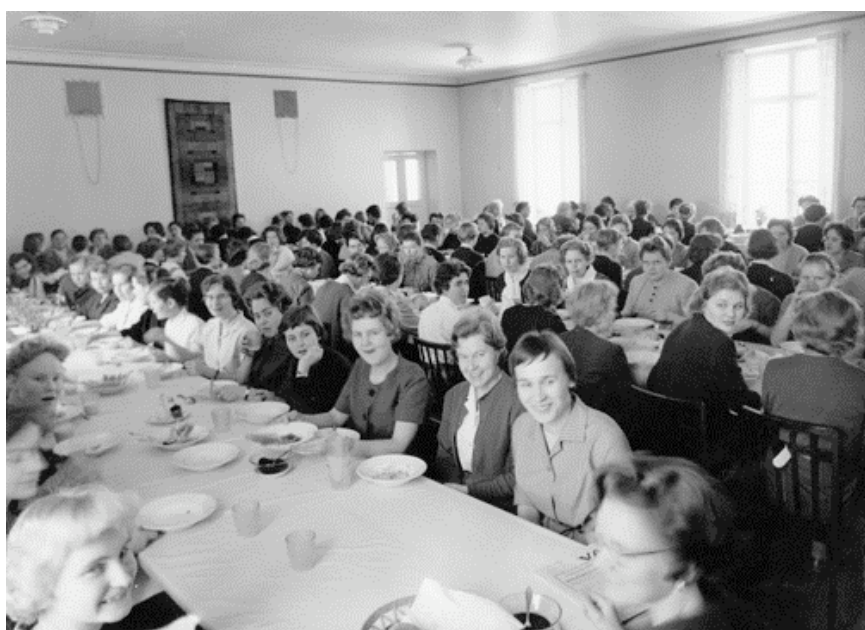
Kuva 23. Wetterhoffin koteollisuusopiston ruokasali vuonna 1960.