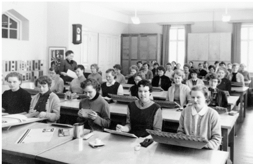
Kuva 22. Piirustustunti Wetterhoffilla vuonna 1959.