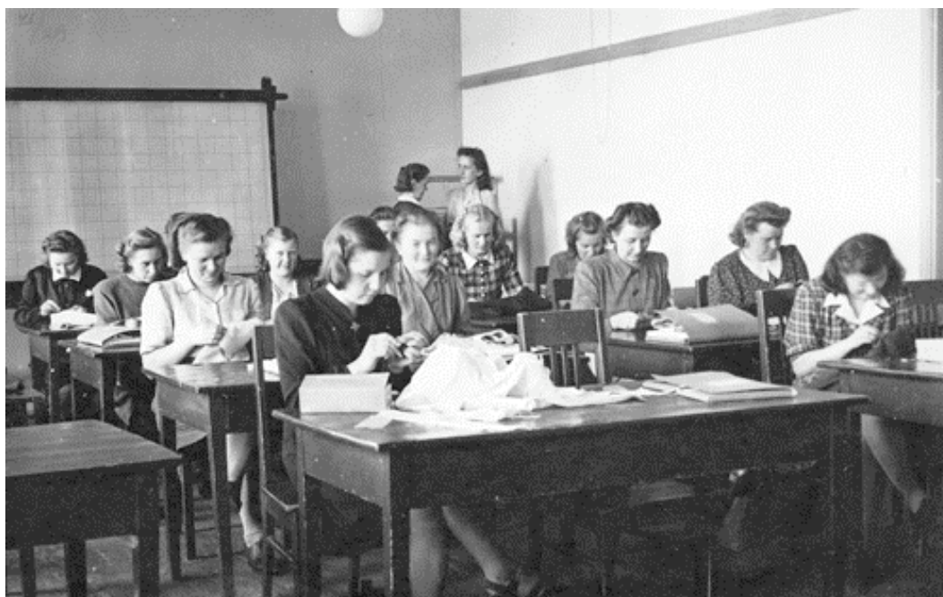
Kuva 16. Pukuompelutunti Wetterhoffilla vuonna 1947.

tilausompelimo, jossa opistosta valmistuneet opettajat voivat harjoitella ja harjaantua sellaisen työn johtamiseen. – Kudonnan- ja ompeluneuvojia koulutettiin sitten Wetterhoffilla aina 1970-luvun puoliväliin asti.