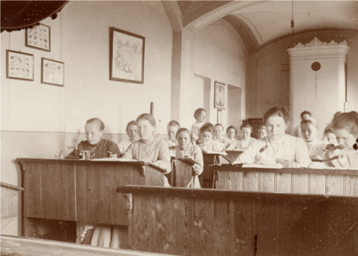
Kuva 3. Piirustustunti Fredrika Wetterhoffin Työkoulussa 1900-luvun alussa.